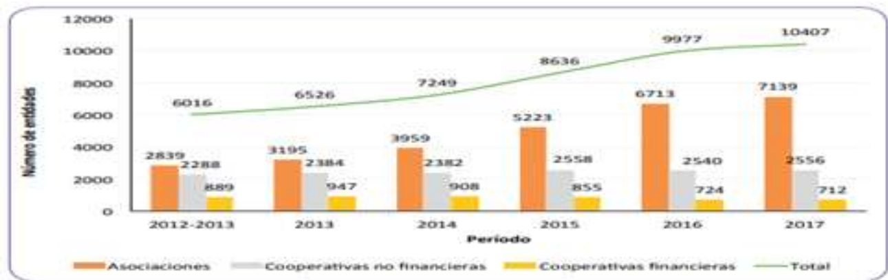
Gráfico 2: Inclusión Económica y social